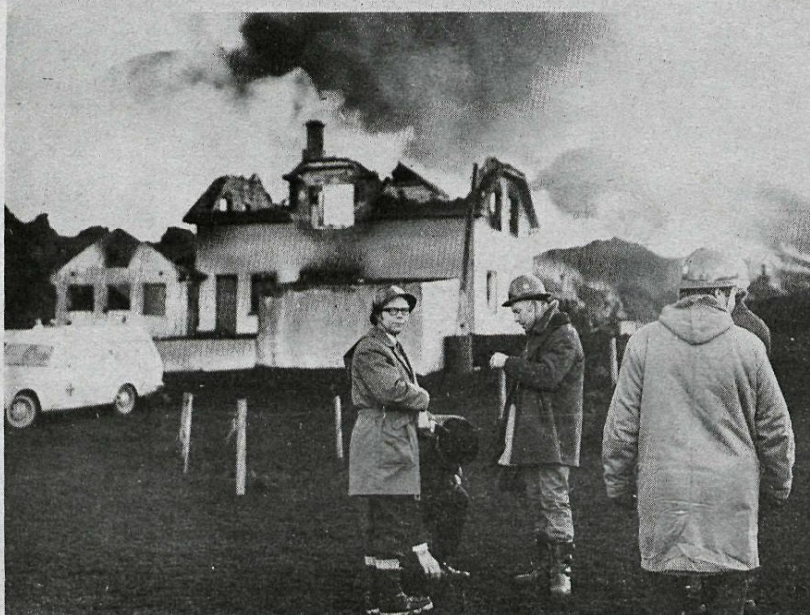
Forsetinn í Vestmannaeyjum í gær.