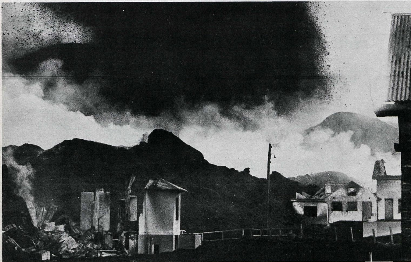
Brunnin og hrunin hús í Kirkjubæ við hraunjaðarinn.

„Hótel Loftleiðir býður gestum sínum að velja á milli 217 herbergja með 34 römun — en gestum standa líka íbúðir til boða. Allur búnaður miðast við strangar kröfur vandlátra. LOFTLEIÐAGESTUM LIDUR VEL.