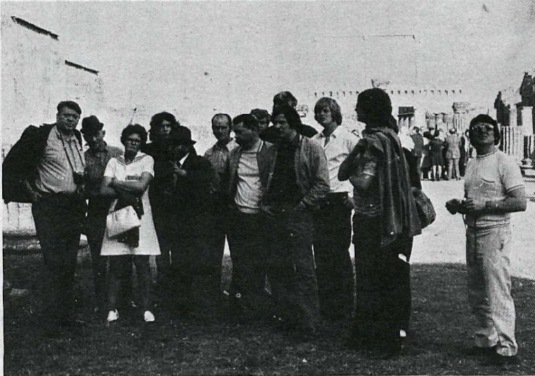
Íslenskur ferðamannahópur í rústum Pompei. Fáum við í framtíðinni svipaða hópa til Heimaeýjar erlendis frá?

farþegum sínum kost á að fljúga yfir Heimaeý Borgin Pompei, við rætur Vesúvíusar, hefur á undanförunum árum verið grafin úr rústum — og er því verki enn ekki lokið. Þangað leitar stöðugt straumur ferðamanna til að skoða minjar Rómaveldis hins forna.